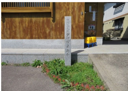
市指定文化財クロガネモチの石碑（写真↑） 宇夫須那神社のクロガネモチ「雌株」（写真→）

なお、宇夫須那の名は盧入姫（いおきのいりひめ）生誕の産屋（うぶや）、生まれた土地の守護神である産土神（うぶすながみ）から来ているともいわれている。（葉栗村志稿及び尾張国風土記より）