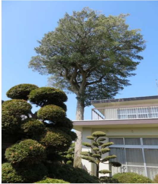
市指定文化財のクロガネモチ「雄株」