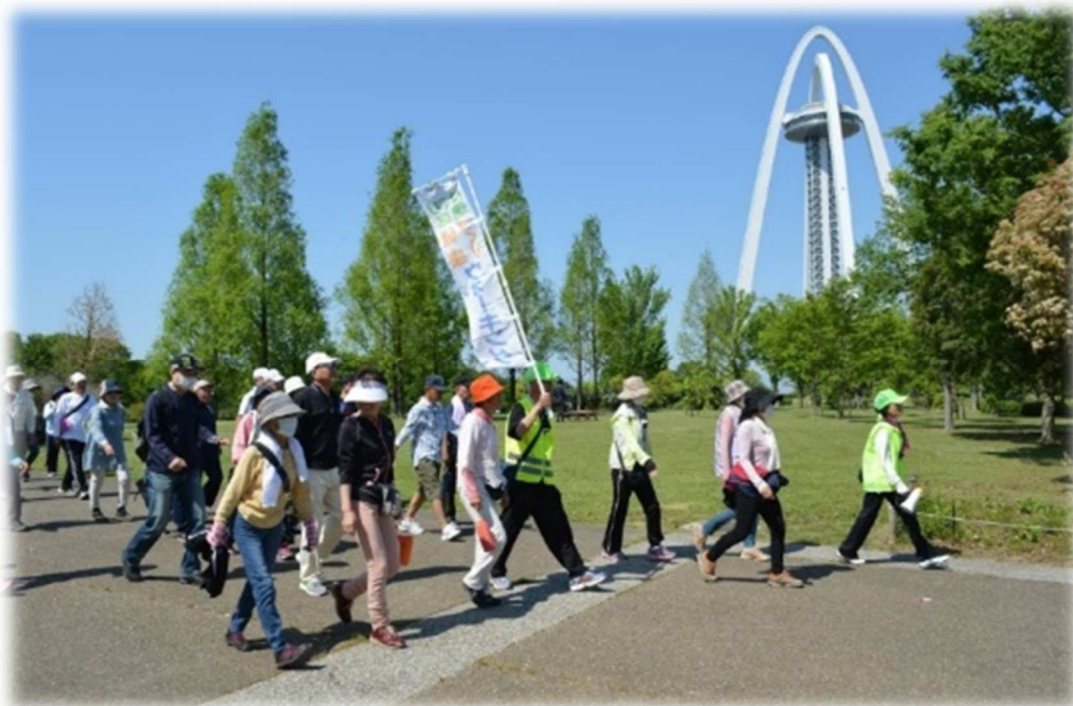
前回(2019.5)のウォーキング大会