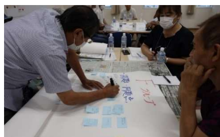
第 1 回自主防災リーダー研修