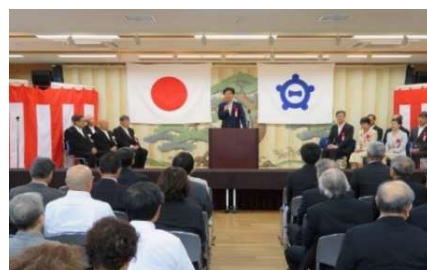
葉栗公民館竣工記念式典