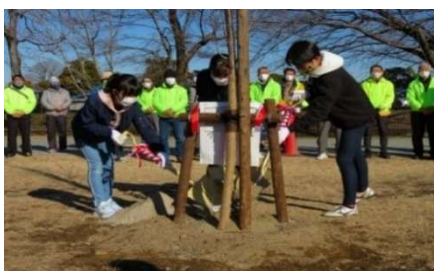
市制 100 周年事業「エドヒガンザクラ」植樹