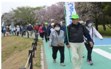
第 1 回健康づくりウォーキング大会