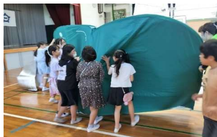
葉栗小学校 4 年生防災体験学習