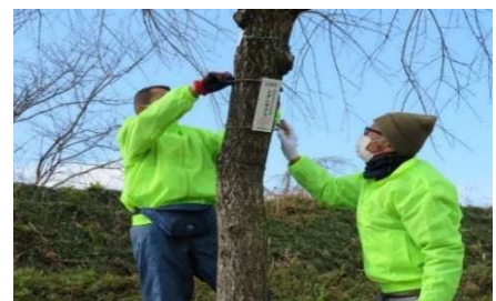
木曾川堤（サクラ）に樹名札取付