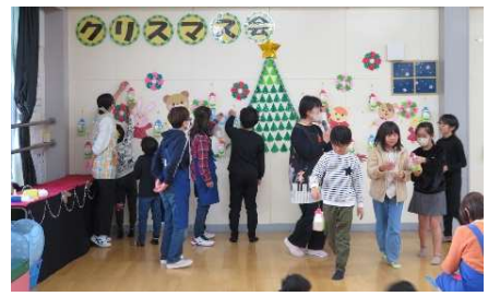
葉栗児童館クリスマス会