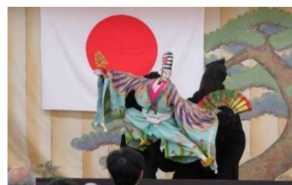
市制 100 周年事業の「島文楽」公演